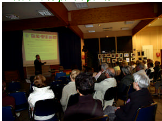
Vue générale de l'assistance

L'Assemblée Générale s'est déroulée en présence d'une quarantaine de membres et de "personnalités" carnacoises, dont: