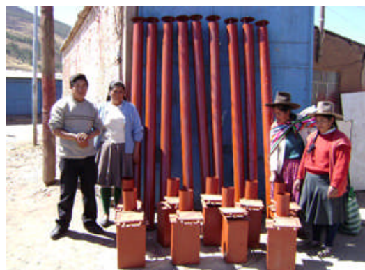
Réception des éléments métalliques à Occobamba Sur