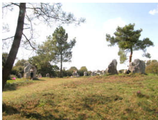
Le quadrilatère de Crucuno