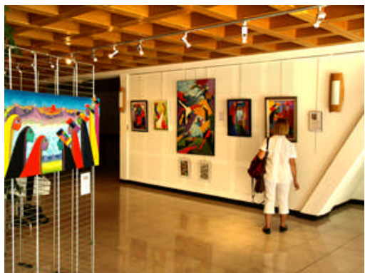
L'exposition dans le hall de la Mairie de Carnac