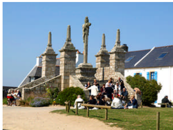
Pique Nique au pied du calvaire de Saint-Cado