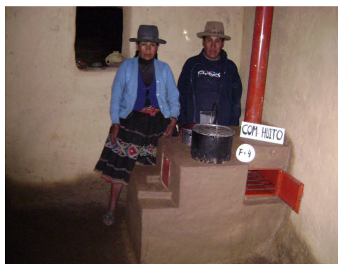
Une famille bénéficiaire de la communauté de Huito

Les communautés de Huito et de Huasapampa sont les premiers bénéficiaires de l'action d'ALPACA Allemagne.